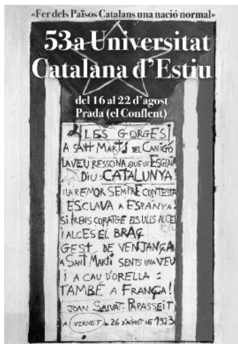
Autor del cartell: Pascal Comelade